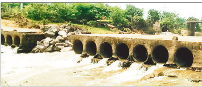
खोलार नदी की टूटी हुई पुलिया।