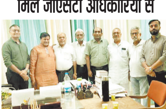
अधिकारियों से मिलते चेम्बर ऑफ कॉमर्स के सदस्य।