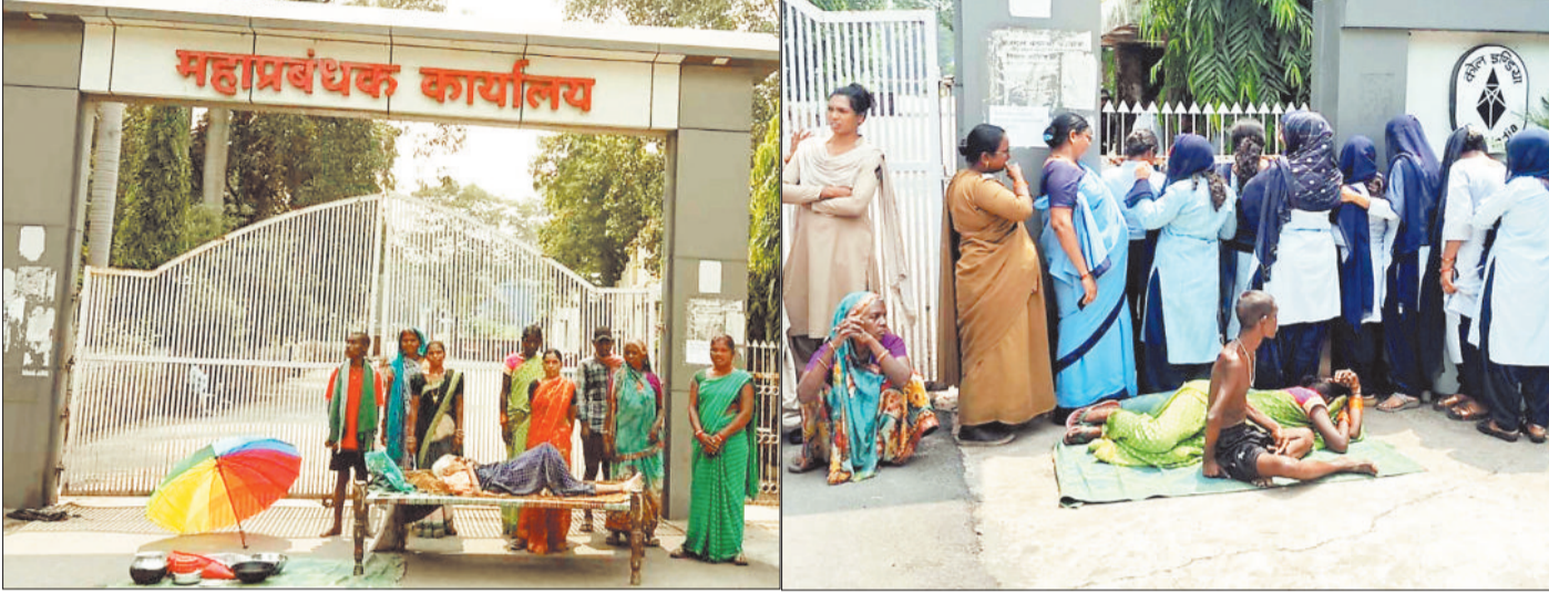
जीएम कार्यालय के मुख्यद्वार पर प्रदर्शन करते भूविस्थापित।